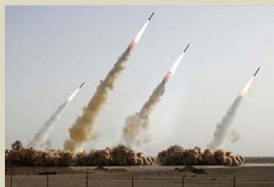
Tidigare iranska provskjutningar med missiler