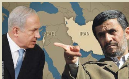
Elitens agenda - Krig med Iran först under hösten 2012

Ett Mellanösternkrig kommer också omedelbart att stänga det så viktiga Hormuzsundet där 40 procent av all sjötransporterad olja passerar. En sådan blockad kommer utan fördröjning att pressa upp oljepriset till storleksordningen 200 dollar per fat. Tanken är att oljepriser i den storleksordningen kommer att ge omedelbara och obotliga skador med risk för hyperinflation på en redan svårt sargad världsekonomi. I detta sammanhang nämner Williams också att "Arabvåren" under 2012 även kommer att nå Saudiarabien. Sannolikt kommer en framtida turbulens enbart i Saudiarabien att kunna åstadkomma ett världsmarknadspris på olja som närmare sig 200 dollar. Som en parantes nämner Williams att hans källa personligen tror att ett krig med Iran också i förlängningen innebär en prolog till ett tredje världskrig.