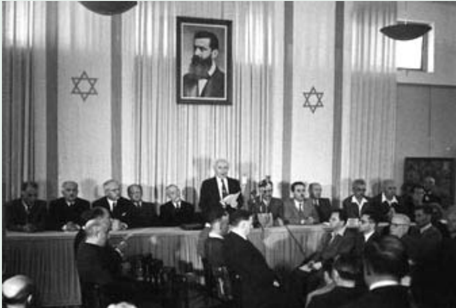
David Ben Gurion deklarerar staten Israels bildande 14 maj 1948.

Tetraden 1949-50 inföll åren efter det att Judarna och världen den 14 maj 1948 sett staten Israels födelse. Den därpå följande tetraden 1967-68 kan på liknande sätt beskrivas som en bekräftelse på att Judarna återtagit Östra Jerusalem under Sexdagarskriget 1967.