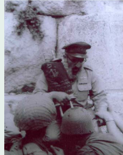
Överrabbin med en Sefer Torah vid den Västra Muren efter befrielsen av Tempelberget 8 juni 1967.

Den första förmörkelsen i 49-50-tetraden den 13 april 1949 var en så kallad "Bull's Eye Blood Moon"-förmörkelse vilken även kunde iakttagas över den nybildade staten Israel. Denna kombination med en tetradförmörkelse som visar sig över Jerusalem, sammanfaller med den Judiska Påsken och dessutom är en "Bull's Eye Blood Moon" är så unik att det sannolikt tidigare aldrig inträffat. Denna händelse kan inte tydas på annat sätt än att det var en extremt kraftig profetisk signal som bekräftade den Israeliska statsbildningen. Den 15 juni 2011 inträffade också en "Bull's Eye Blood Moon" över Jerusalem och ytterligare en kommer att visa sig den 27 juli 2018, dessa ingår dock inte i någon tetrad utan tillhör Ox- respektive Krabbförmörkelserna .