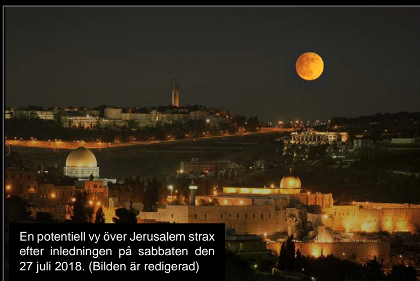
En potentiell vy över Jerusalem strax efter inledningen på sabbaten den 27 juli 2018. (Bilden är redigerad)

Tegmine eller Tegmen (gul illustrationen) är belägen i krabbkroppens alla nedersta del och namnet härstammar bland annat från hebreiskan med betydelsen "hålla fast", stjärnan kallas också Nepa från grekiskan och betyder då "greppa tag".