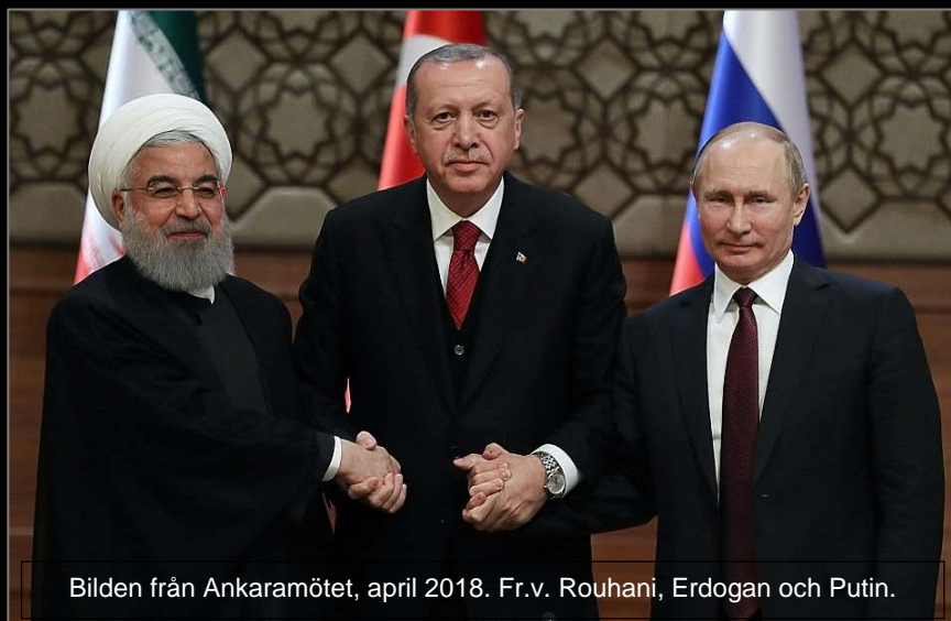
Bilden från Ankaramötet, april 2018. Fr.v. Rouhani, Erdogan och Putin.

Redan under våren träffades president Erdogan, president Putin och president Rouhani i Ankara för att skapa en gemenensam turkisk-rysk-iransk allians i Syrienkriget i syfte att utmana USA och västs inflytande i regionen.