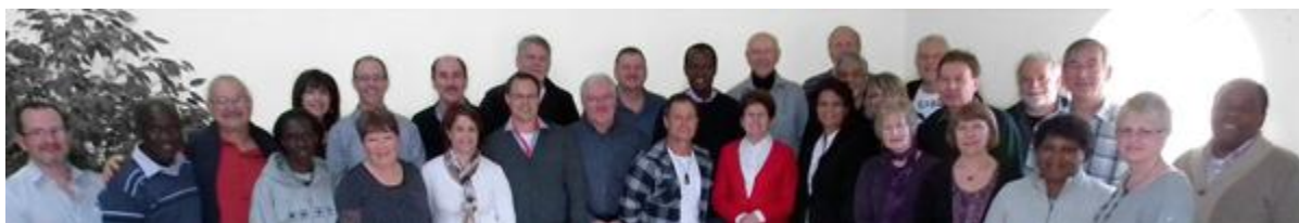
The Salt & Light International Team are made up of leaders from across our international family of churches. Salt & Light International Team består av ledare från våra internationella kyrkofamiljer.

http://www.saltlight.org/international/international-team - International Team